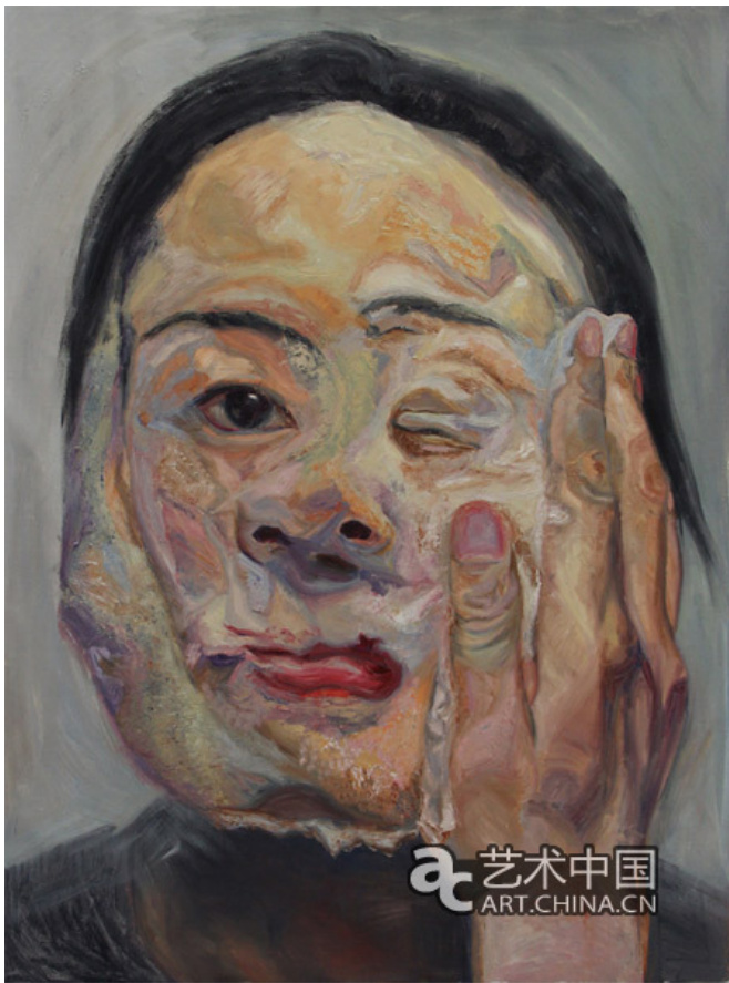
(图二：杨苏近期女权系列作品 - Double Faces Pre & Post Cosmetic Surgery双脸整容手术之前和之后-1, 布面油画, 113 × 150 厘米, 2016)